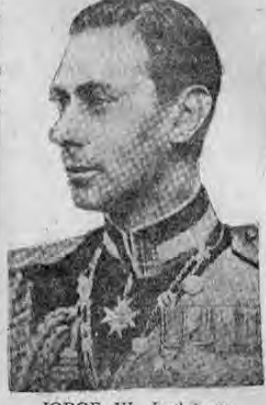
JORGE VI, Inglaterra